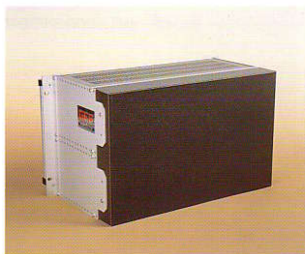
COPERTURA POSTERIORE 6HE 84TE COD. 120H684