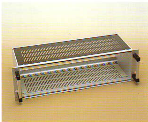
COPERTURE SUPERIORI-INFERIORI COD. 012H084*

Le coperture dei racks G.F.P. sono in acciaio zincato e plastificato. Hanno una pellicola protettiva di spellabile plastico molto utile durante la lavorazione e il trasporto.