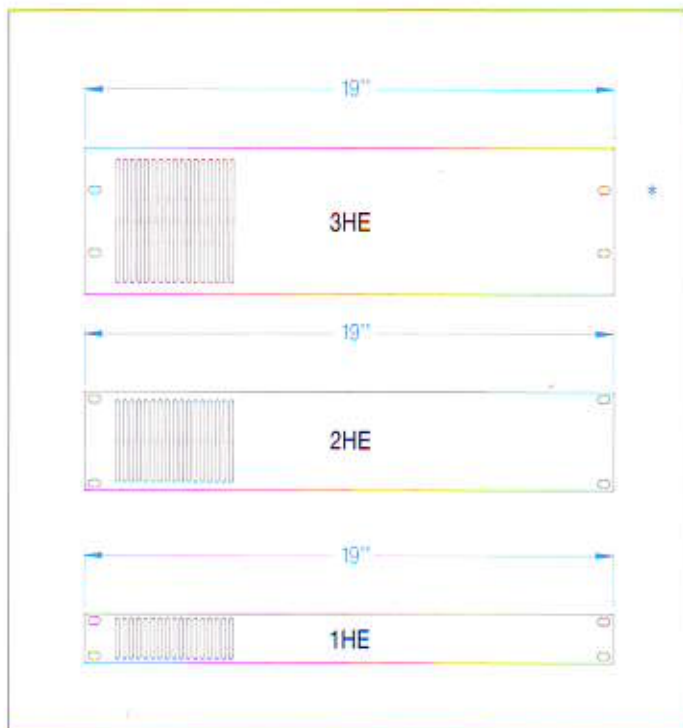
PANNELLO 19" = 482,6xHE - ALLUMINIO SPESSORE mm 3

Se richiesto vengono applicate due maniglie uguali a quelle dei rack e/o viene eseguita l'aerazione (spacchi verticali) nella quantità necessaria.